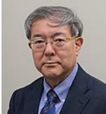
福岡県半導体 ソリューションセンター センター長