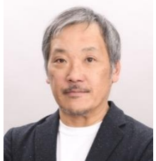
エヌビディア(同) エンタープライズマーケティング 本部長