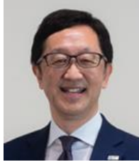
福岡半導体 リスティングセンター センター長