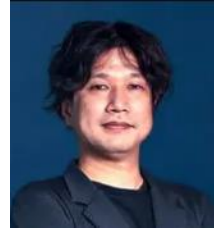
(株)Preferred Networks エンジニアリング担当VP 技術企画本部部長