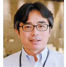
(公財)九州経済調査協会 常務理事